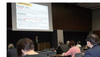
12/19立憲フォーラムに参加 ジャーナリスト半田滋氏講演