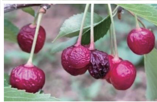
高温障害で樹上でシワシワになったサクランボ

6/25 農水省の果樹のご担当の方、農業共済のご担当の方に参議院会館まで来てもらい、 被害対策を要望 。各種制度のご説明を頂きました。✓